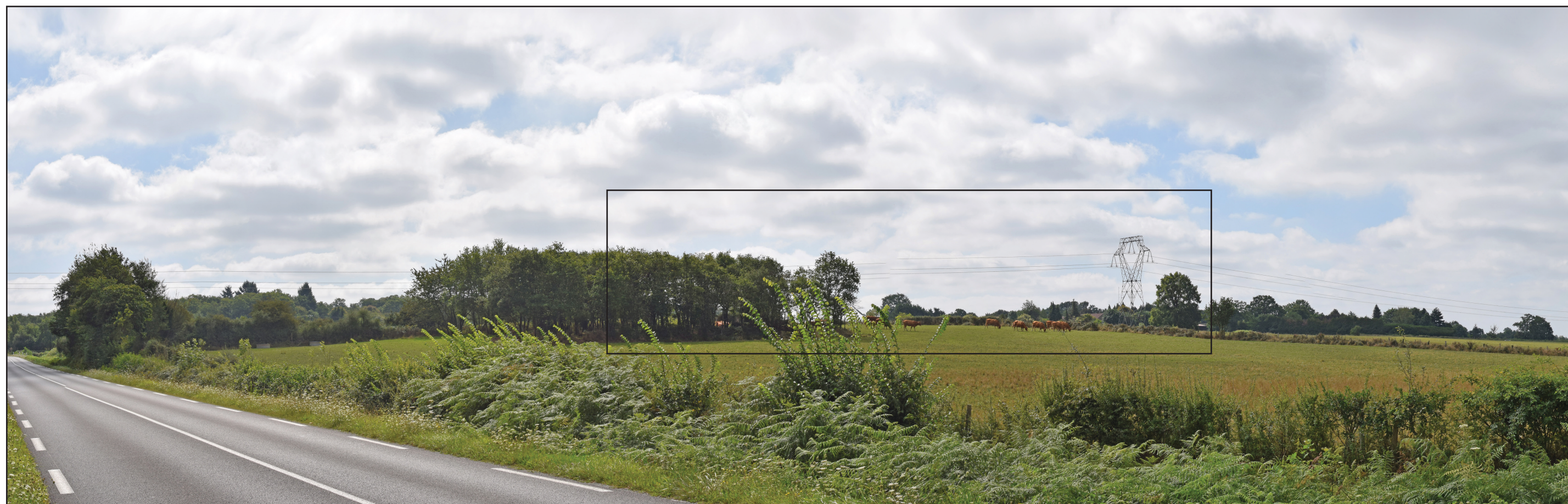
Vue réaliste photomontée (angle de vue 80°)

Le photomontage doit être observé à une distance de 24 cm pour correspondre à une vue réaliste (impression A3)